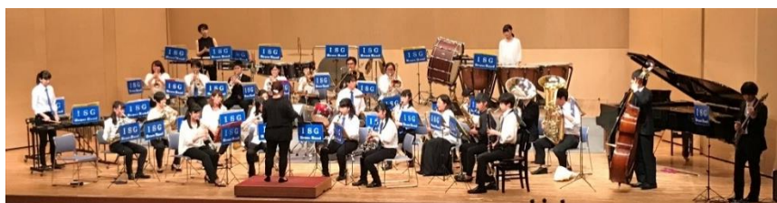
OB、OGを含めた全体合奏