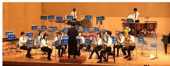
現役生徒（1～3年生）の合奏